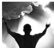
Todas las ilustraciones de las lecturas de meditación Cuaresmal son cortesía de la Hermana Claire Joy de la Comunidad del Espíritu Santo