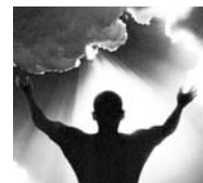
Todas las ilustraciones de las lecturas de meditación Cuaresmal son cortesía de la Hermana Claire Joy de la Comunidad del Espíritu Santo